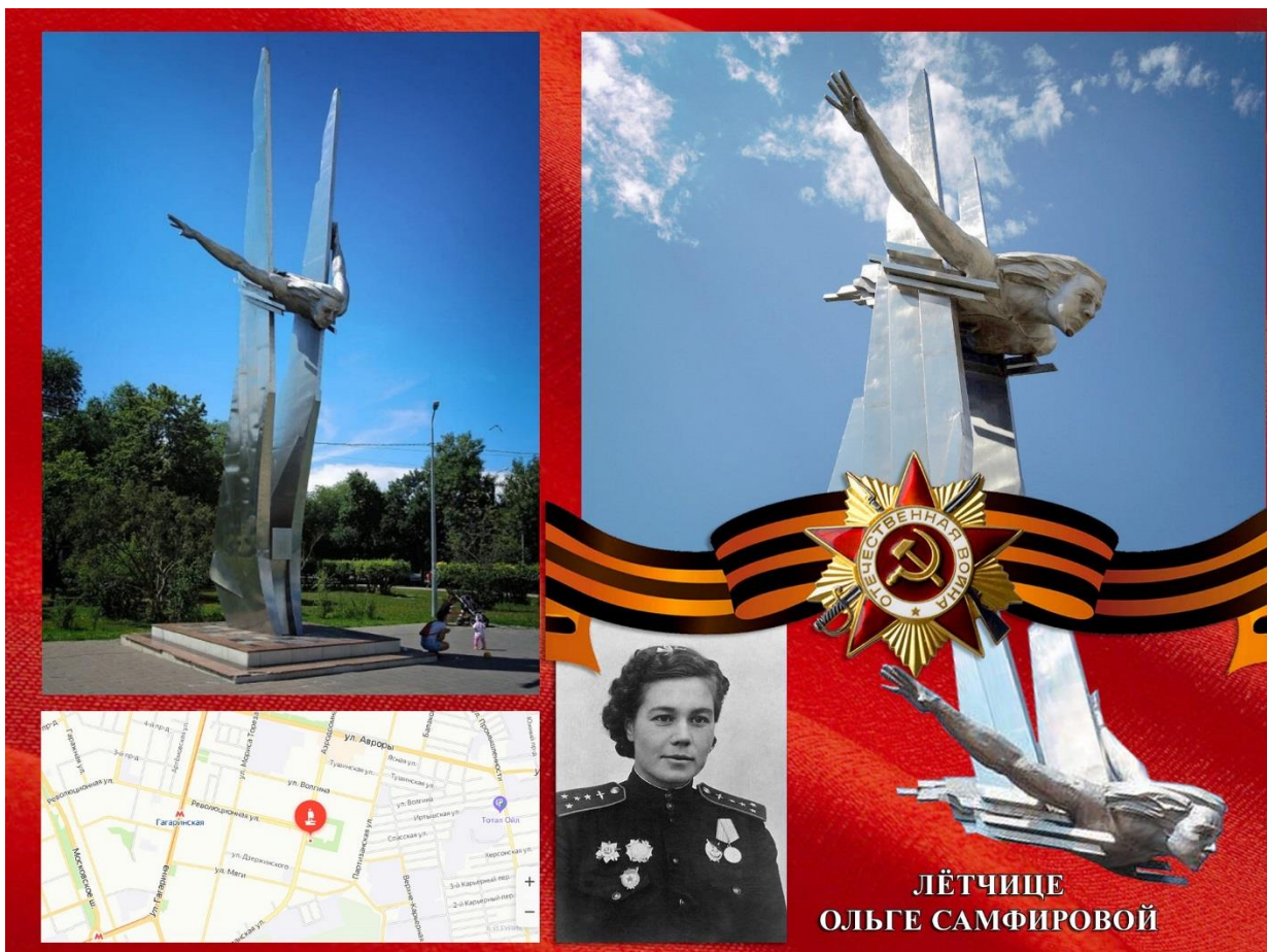
Фото: Памятник Лётчице Ольге Санфировой