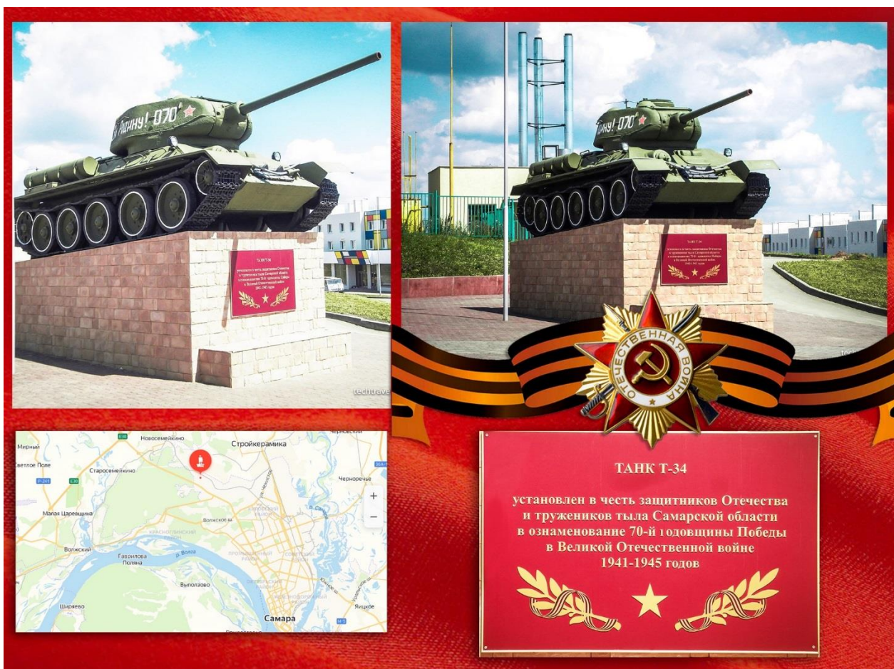
Фото. Монумент танк Т - 34

В микрорайоне «Крутые ключи» на постаменте был установлен знаменитый советский средний танк Т-34-85. Открытие монумента было приурочено ко Дню Героя, который отмечается в России 9 декабря.