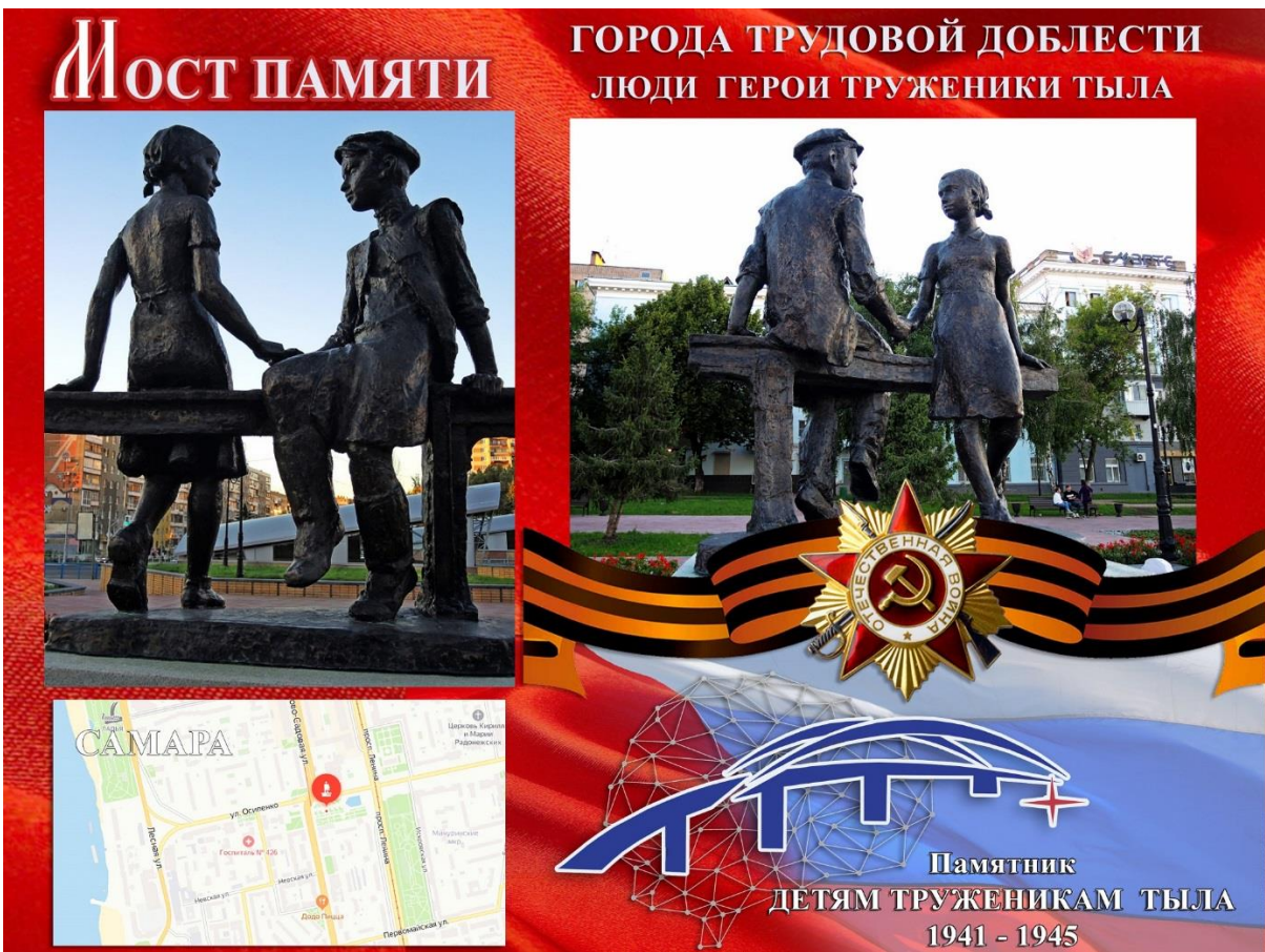
Фото: «Детям труженикам тыла»