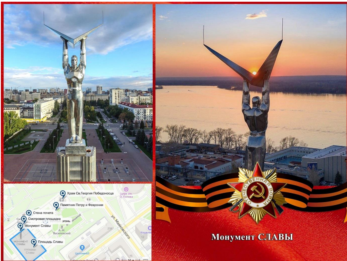
Фото: Монумент Славы